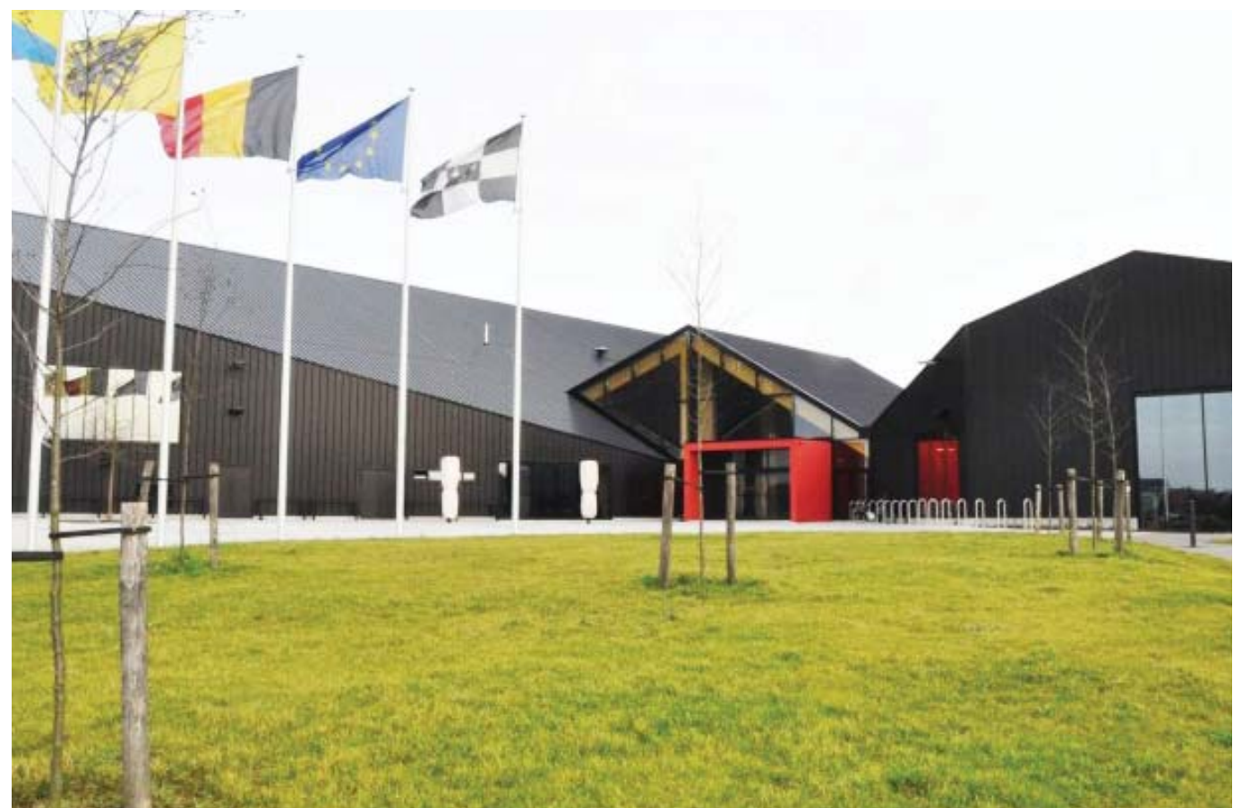
De kiss en ride-zone aan de voorzijde van het Vrijtijdscentrum kan gebruikt worden om de kinderen af te zetten en op te halen.

Ouders die kinderen met de wagen brengen, kunnen gebruik maken van de parking. De rotonde voor het centrum kan gebruikt worden als kiss & ride.