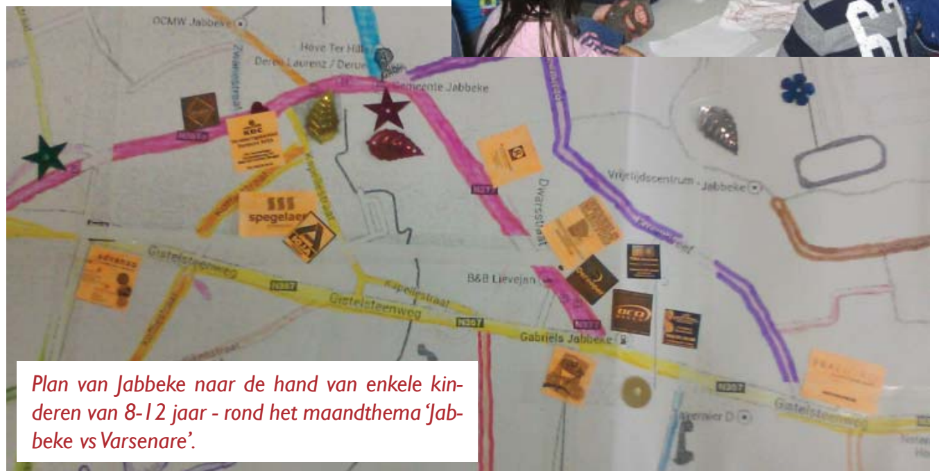
Plan van Jabbeke naar de hand van enkele kinderen van 8-12 jaar - rond het maandthema 'Jabbeke vs Varsenare'.

De dienst kreeg een uitbreiding van haar werking met de integratie van de gemeentelijke speelpleinwerking. Daardoor kan de kwaliteitsaanpak van de dienst buitenschoolse kinderopvang ook in de vakantieperiodes verdergezet worden. In de vakantiespeelpleinwerking Speelkriebels zijn er 120 kinderen op de locaties Jabbeke en Varsenare.