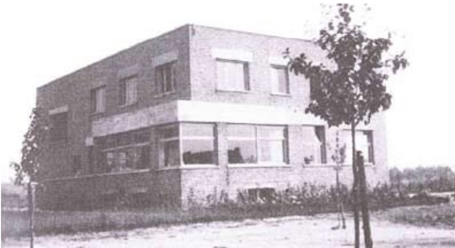
'De Vier Winden' omstreeks 1930, vanuit de tuin gezien.